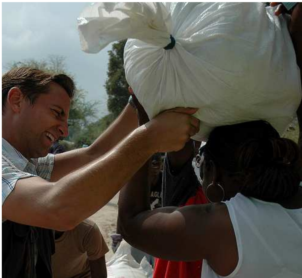
Operación de reparto de ayuda alimentaria.