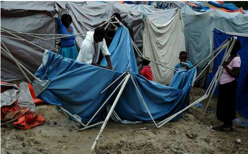
Instalación de una tienda de campaña distribuida por Cáritas en un campo de desplazados.

Cáritas quiere favorecer estos movimientos, que parten de un sentimiento popular de solidaridad y de unidad familiar, fuertemente arraigado en la sociedad haitiana. Cáritas Española está trabajando en la atención a estas personas en la provincia central de Haití, en la Diócesis de Hinche, donde han llegado miles de desplazados, a los que se les proporciona alimentos, artículos de higiene y materiales de construcción para ampliar y acondicionar las viviendas para que puedan acoger a un mayor número de personas.