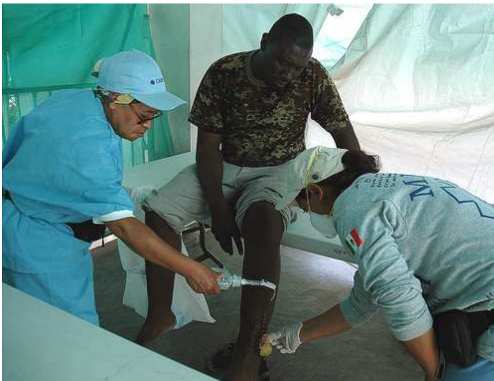
Un herido recibe atención médica en una de las clínicas temporales instaladas por Cáritas.

También existe una excelente coordinación con el PMA con el fin de evitar duplicaciones con la distribución de alimentos directamente con las Cáritas diocesanas.