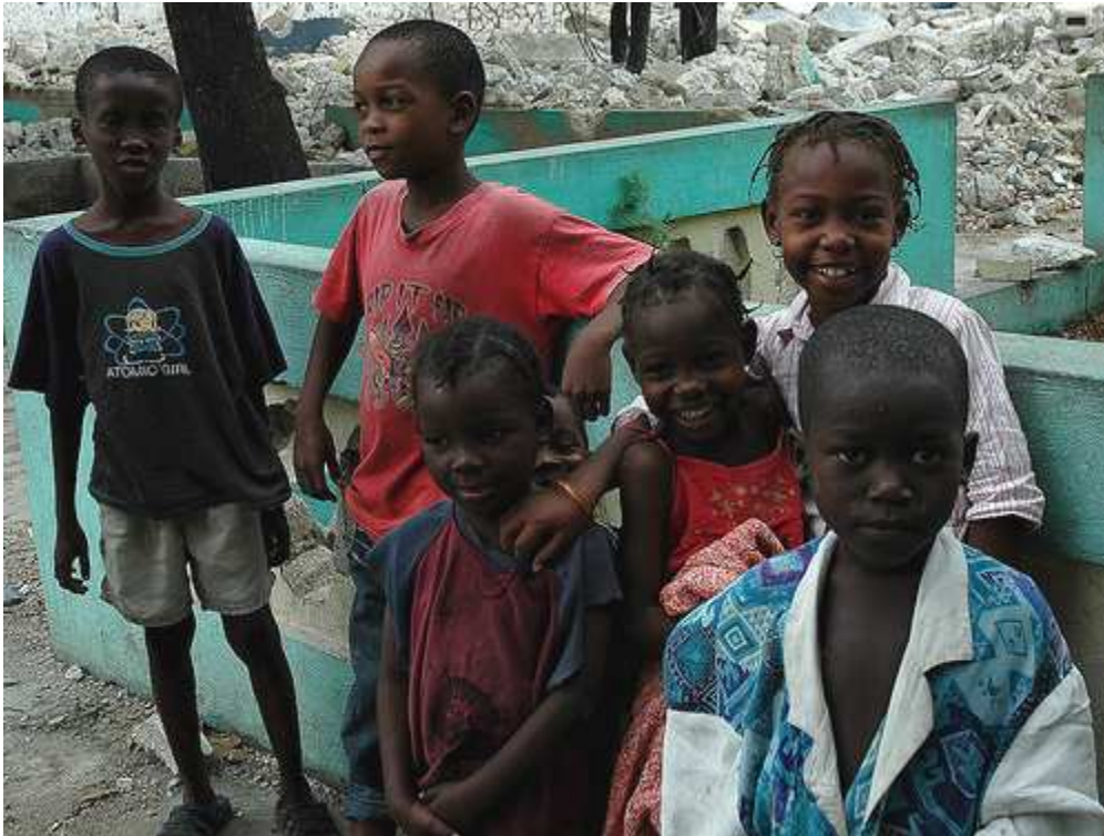
Los niños son uno de los gúidos de atención prioritaria para Cáritas.