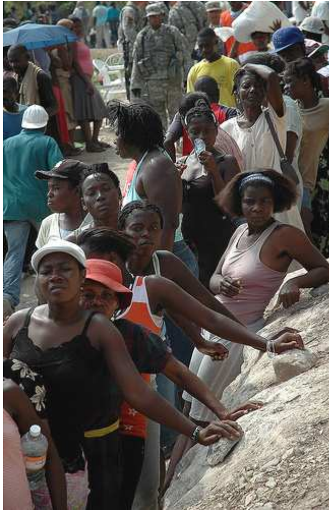
Un grupo de mujeres esperan el reparto de ayuda en uno de los campos de Puerto Príncipe.