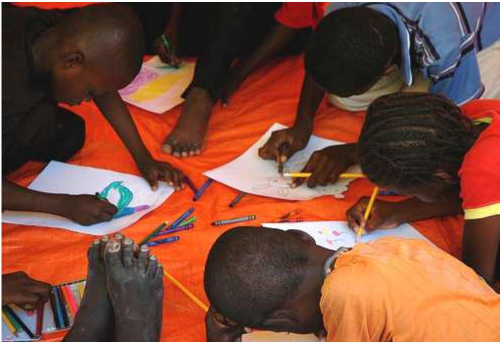
Un grupo de niños participan en un proyecto de tiempo libre organizado por Caritas dentro de un campo de desplazados.